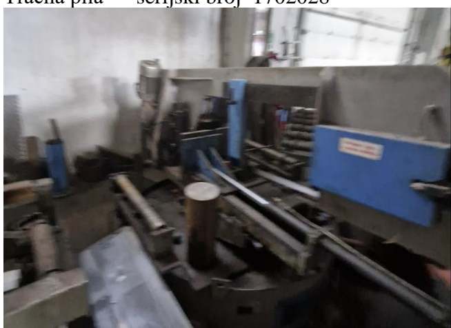
9. Stol za prijenos materijala sa valjcima uz tračnu pilu