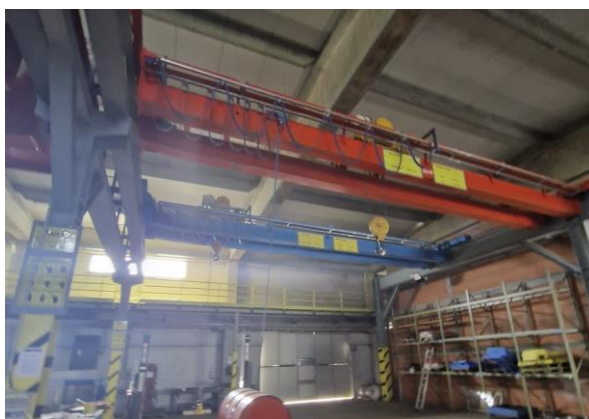
15. Dizalica mosna D-3, 3,2 t, RN-8025